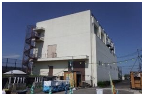
北部配水場更新工事